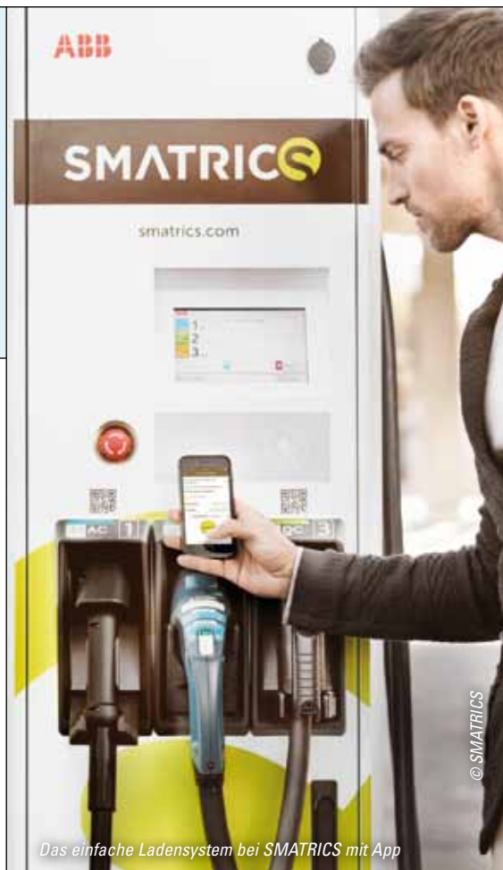
Das einfache Ladensystem bei SMATRICS mit App

Entwicklung gegangen sind, sondern weil wir seit neuestem unseren Gästen auch einen erweiterten Service bieten können“.